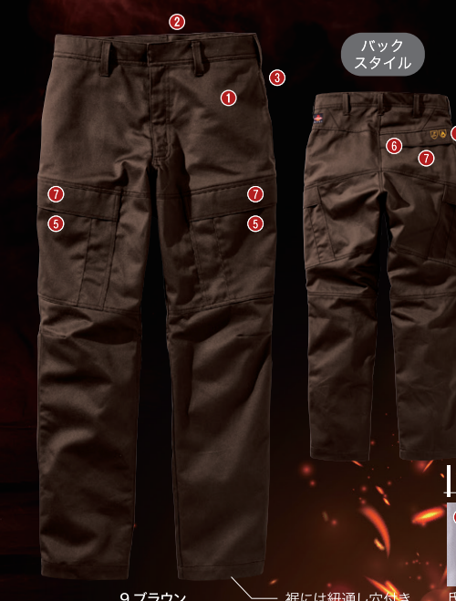
9.ブラウン 裾には紐通し穴付き