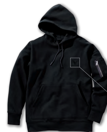
99. クリスタルブラック