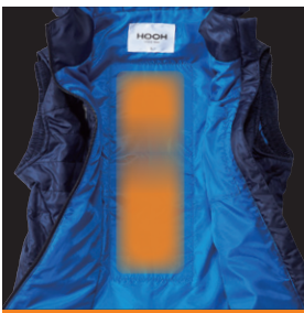
背中にヒーター内蔵