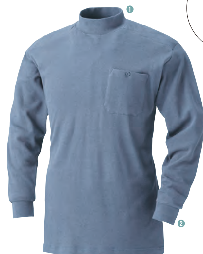
40. ミスティープール

やさしく包み込むオール Cotton の肌触り スパン入りで首回り袖口が伸びにくい