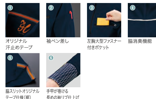
オリジナル汗止めテープ