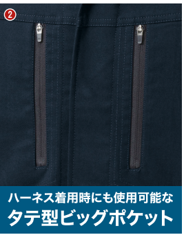
ハーネス着用時にも使用可能な タテ型ビッグポケット