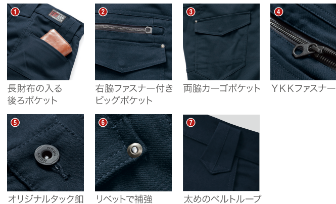
1. 長財布の入る後ろポケット 2. 右脇ファスナー付きビッグポケット 3. 両脇カーゴポケット 4. YKKファスナー 5. オリジナルタック釦 6. リベットで補強 7. 太めのベルトループ