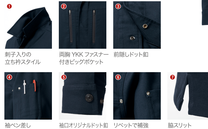
1. 刺子入りの立ち衿スタイル 2. 両胸 YKK ファスナー付きビッグポケット 3. 前隠しドット釦 4. 袖ベン差し 5. 袖口オリジナルドット釦 6. リベットで補強 7. 脇スリット