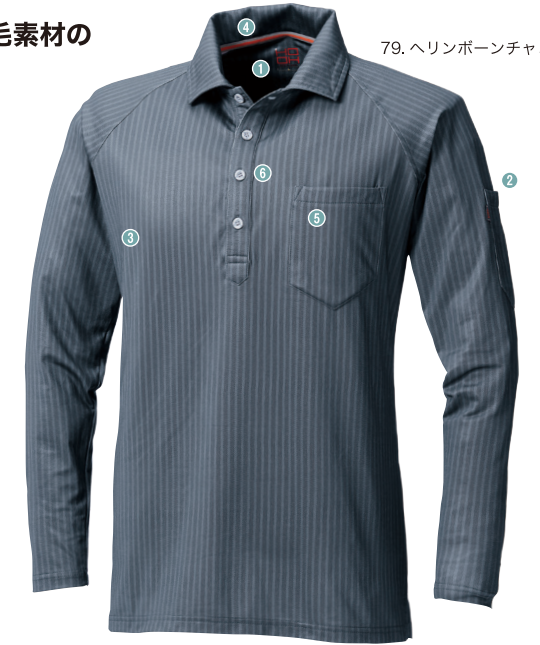
79.ヘリンボーンチャコール