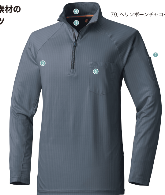
79.ヘリンボーンチャコール