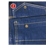
胸ポケット スナップ釦