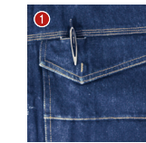
胸ポケットベン差し