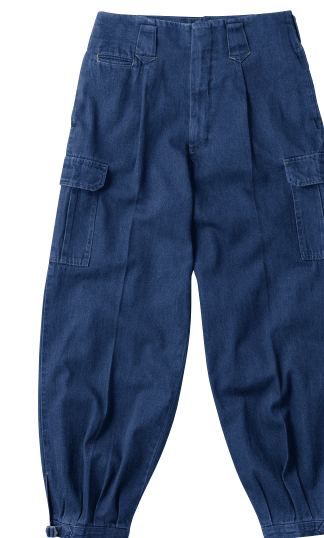
52. インディゴブルー