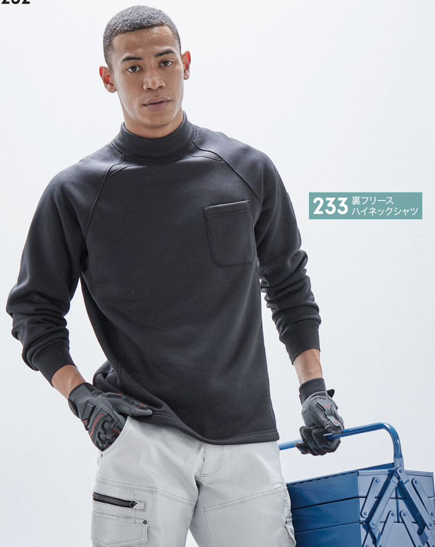
233 裏フリース ハイネックシャツ

ポロシャツでも人気の立衿スタイルを提案。 スマートに着こなす為に デザインと素材にこだわりました。