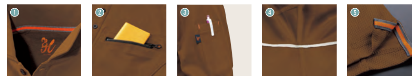
1 襟オリジナル汗止めテープ 2 左胸ビッグポケット 3 袖ベン差し 4 脇消臭テープ 5 脇スリットオリジナルテープ