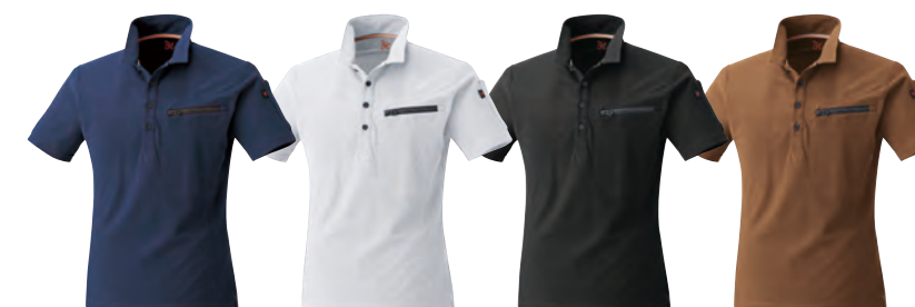
1. ネイビー 17. ホワイト 20. ブラック 74. キヤメル