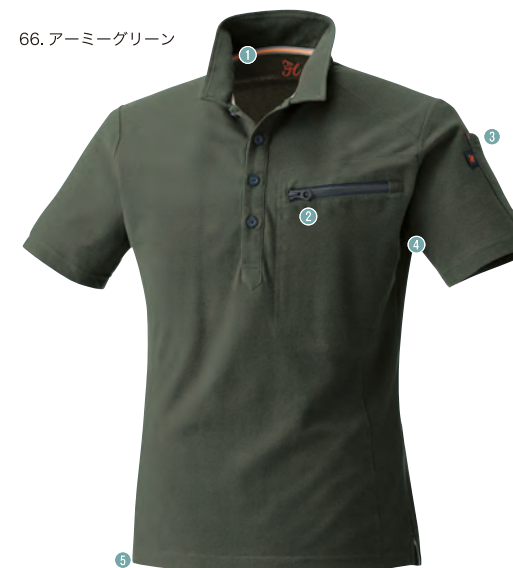
66. アーミーグリーン