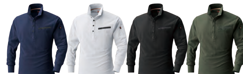
1. ネイビー 17. ホワイト 20. ブラック 66. アーミーグリーン