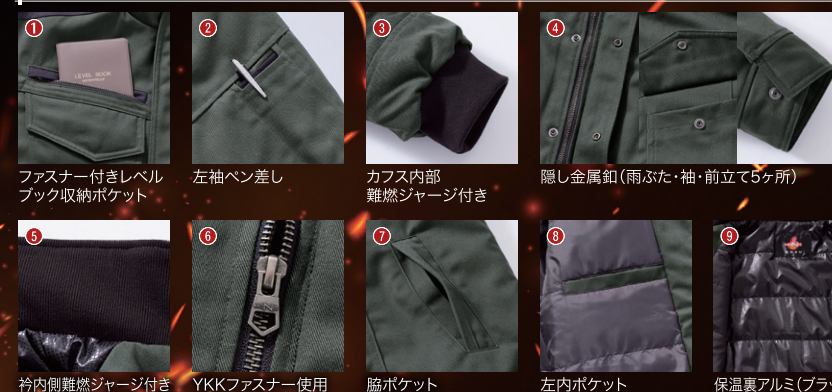
1. フラスナー付きレベルブック収納ポケット 2. 左袖ベン差し 3. カブス内部 難燃ジャージ付き 4. 隠し金属釦 (雨ふた・袖・前立て5ヶ所) 5. 衿内側難燃ジャージ付き 6. YKKフラスナー使用 7. 脇ポケット 8. 左内ポケット 9. 保温裏アルミ (ブラック)