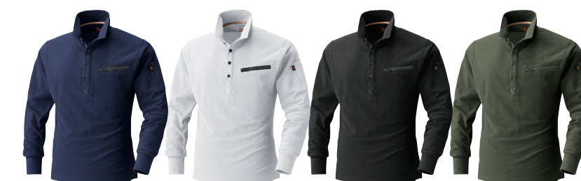
1. ネイビー 17. ホワイト 20. ブラック 66. アーミーグリーン