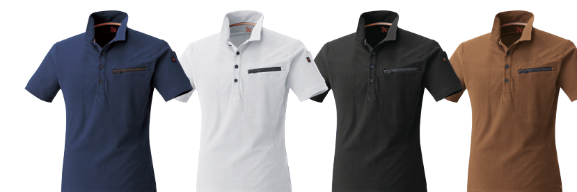
1. ネイビー 17. ホワイト 20. ブラック 74. キヤメル