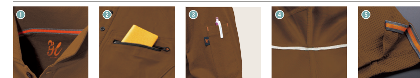
1 衿オリジナル汗止めテープ 2 左胸ビッグポケット 3 袖ベン差し 4 脇消臭テープ 5 脇スリットオリジナルテープ