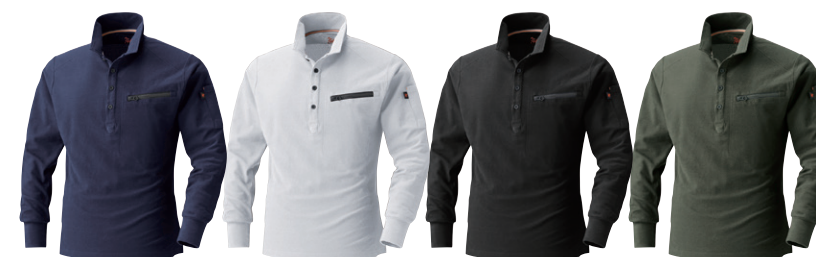
1. ネイビー 17. ホワイト 20. ブラック 66. アーミーグリーン