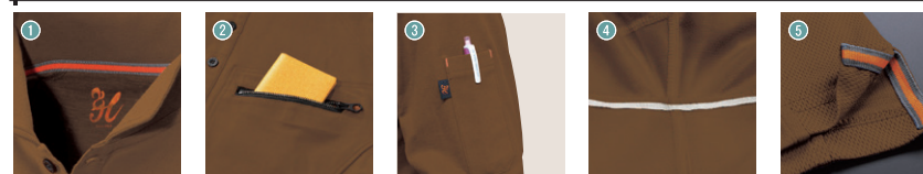
1. 衿オリジナル汗止めテープ 2. 左胸ビッグポケット 3. 袖ベン差し 4. 脇消臭テープ 5. 脇スリットオリジナルテープ