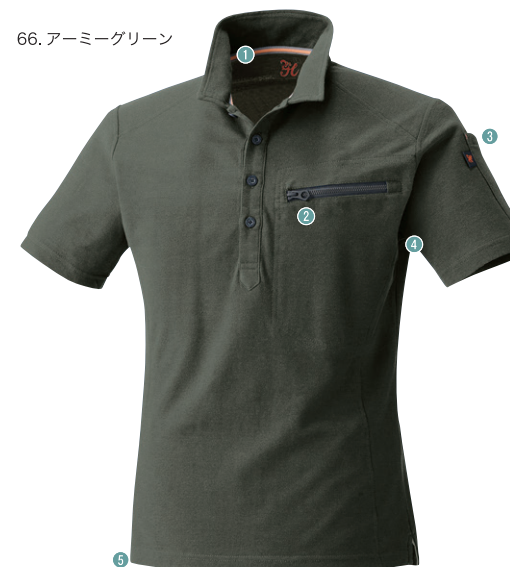
66. アーミーグリーン