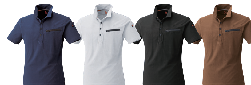
1. ネイビー 17. ホワイト 20. ブラック 74. キヤメル