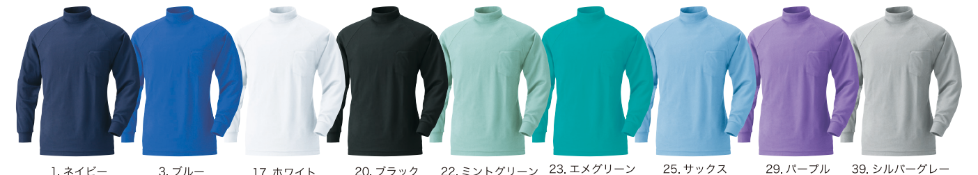
1. ネイビー 3. ブルー 17. ホワイト 20. ブラック 22. ミントグリーン 23. エメグリーン 25. サックス 29. パープル 39. シルバーグレー