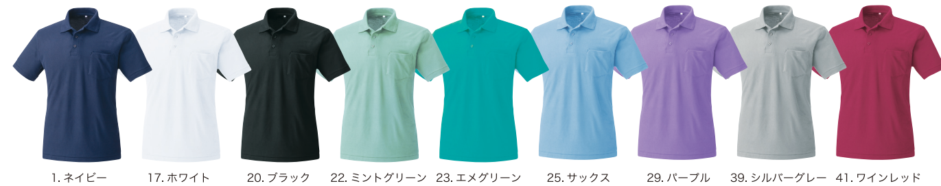
1. ネイビー 17. ホワイト 20. ブラック 22. ミントグリーン 23. エメグリーン 25. サックス 29. パープル 39. シルバーグレー 41. ワインレッド