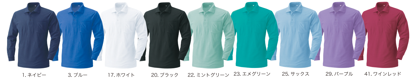
1. ネイビー 3. ブルー 17. ホワイト 20. ブラック 22. ミントグリーン 23. エメグリーン 25. サックス 29. パープル 41. ワインレッド