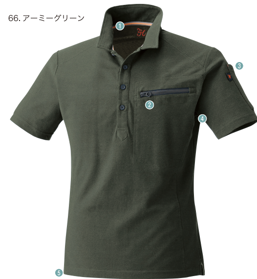
66. アーミーグリーン