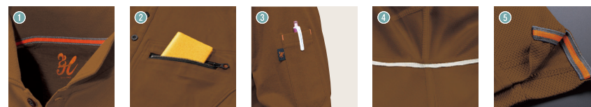
1 衿オリジナル汗止めテープ