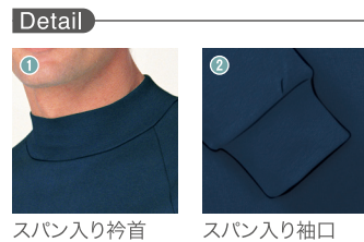
スパン入り衿首 スパン入り袖口