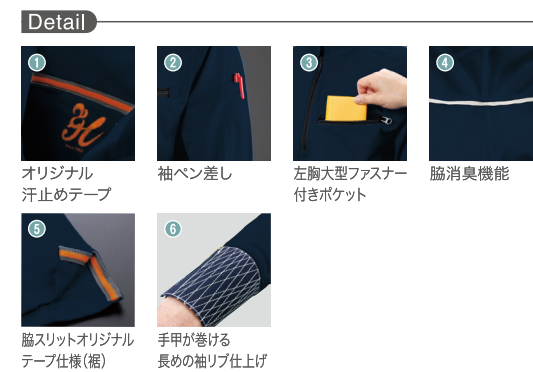
脇スリットオリジナルテープ仕様(裾) 手甲が巻ける長めの袖リブ仕上げ