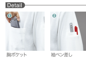
胸ポケット 袖ベン差し