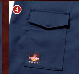
隠し金属釦付きポケット