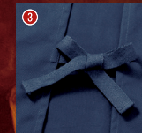
後ろヒモ使用 (2カ所)