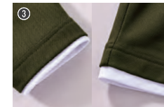
③ レイヤード部分 (袖口・裾)