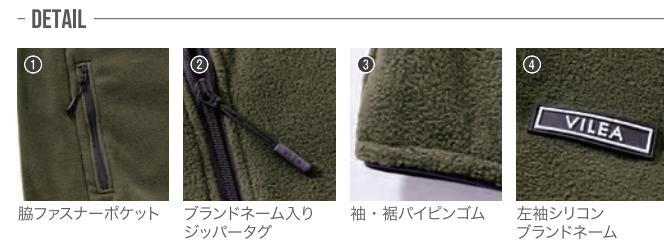
① 胸ファスナーポケット ② ブランドネーム入りジッパータグ ③ 袖・裾ハイピンゴム ④ 左袖シリコンブランドネーム