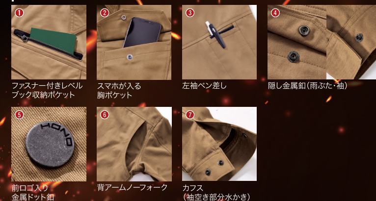
前口入り金属ドット釦