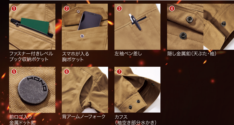
前口入り金属ドット釦 背アームノーフーク カフス (袖空き部分水かき)