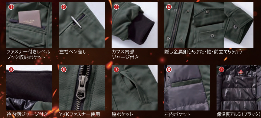
1. フラスナー付きレベルブック収納ポケット 2. 左袖ベン差し 3. カブス内部ジャージ付き 4. 隠し金属釦(天ふた・袖・前立て5ヶ所) 5. 衿内側ジャージ付き 6. YKKファスナー使用 7. 脇ポケット 8. 左内ポケット 9. 保温裏アルミ(ブラック)