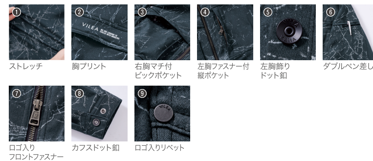
1 ストレッチ 2 胸プリント 3 右胸マチ付ビックポケット 4 左胸ファスナー付縦ポケット 5 左胸飾りドット紐 6 ダブルボタン差し 7 ロゴ入りフロントファスナー 8 カフスドット紐 9 ロゴ入りリベット