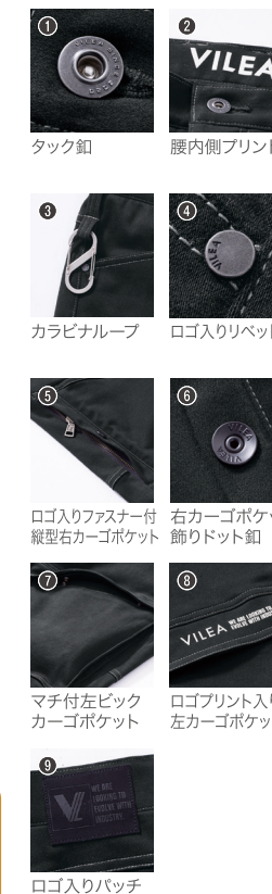
1 タック紐 2 腰内側プリント 3 カラーナループ 4 ロゴ入りリベット 5 ロゴ入りファスナー付縦型右カーゴポケット 6 右カーゴポケット飾りドット紐 7 マチ付左ビックカーゴポケット 8 ロゴプリント入り左カーゴポケット 9 ロゴ入りパッチ