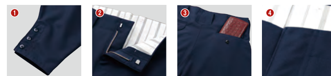
裾口三ツ釦 こだわりの裏地 深い後ポケット ダブルステッチ