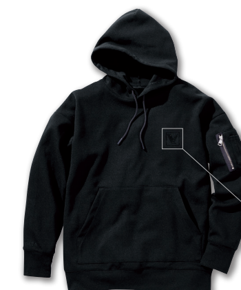
99. クリスタルブラック