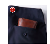
長財布が入る後ポケット