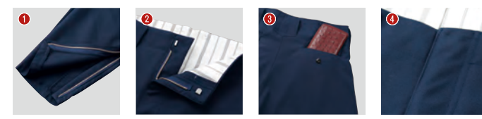
裾ファスナー こだわりの裏地 深い後ポケット ダブルステッチ