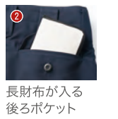
長財布が入る後ポケット