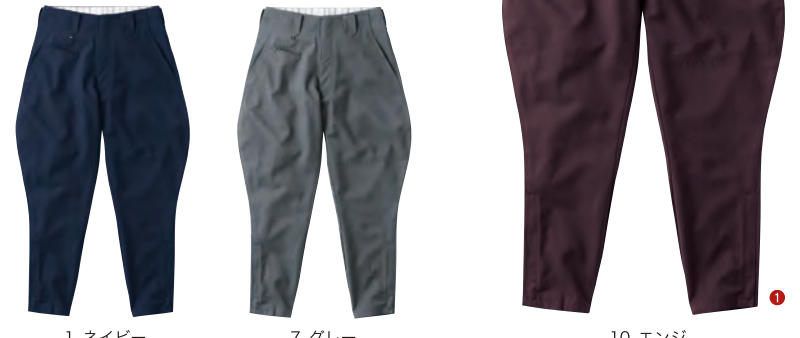
1. ネイビー 7. グレー 10. エンジ