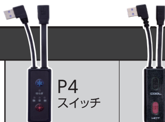
スイッチ・モバイルバッテリー互換表