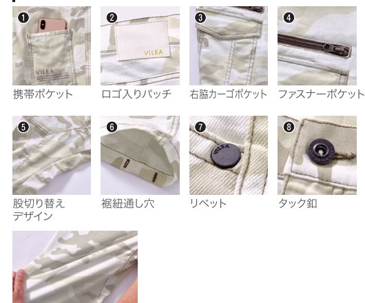
1 携帯ポケット 2 ログ入りパッチ 3 右脇カーゴポケット 4 ファスナーポケット