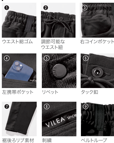
1 ウエスト総ゴム 2 調節可能なウエスト紐 3 右コインポケット