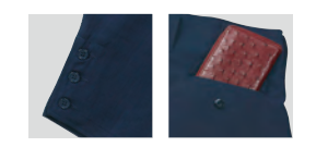
裾口3ツ釦 深い後ポケット