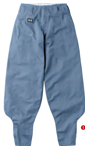
40. ミスティープルー