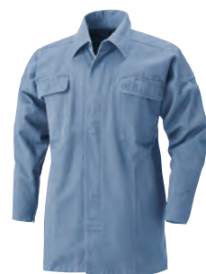
40. ミスティープルー