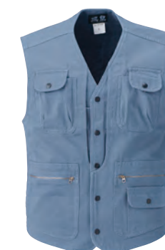
40. ミスティープルー