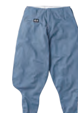
40. ミスティープルー