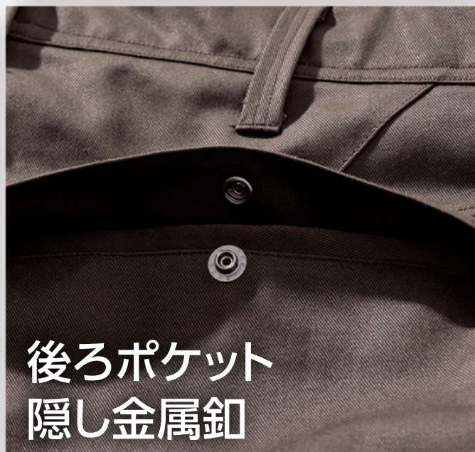
後ろポケット 隠し金属釦