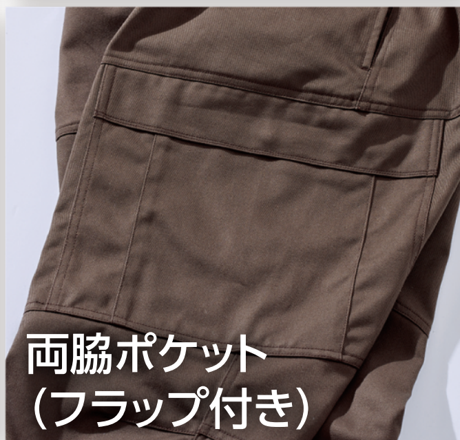
両脇ポケット (フラップ付き)