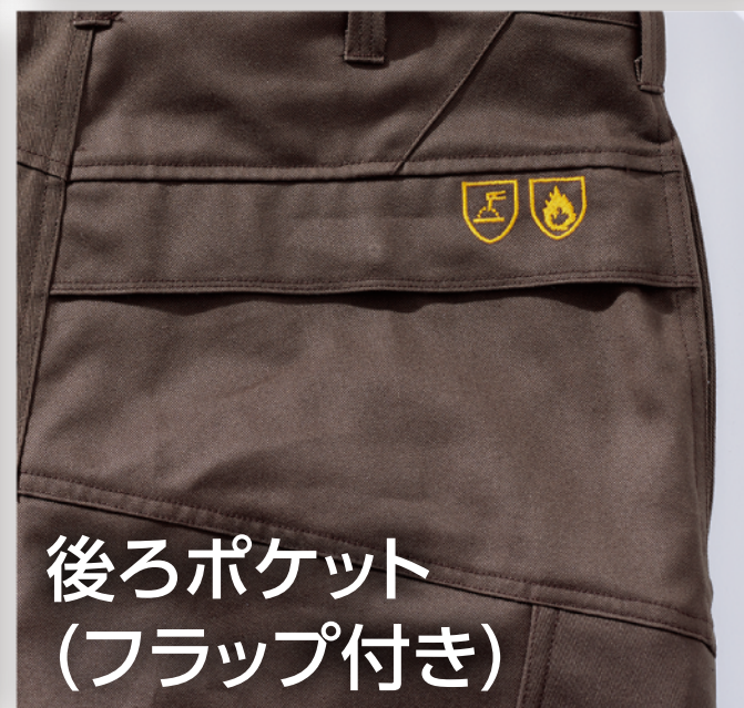
後ろポケット (フラップ付き)