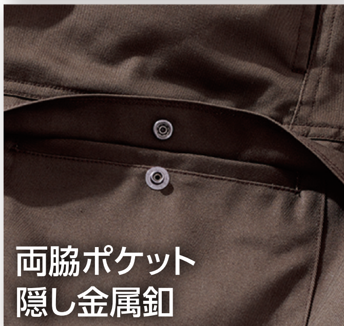
両脇ポケット 隠し金属釦