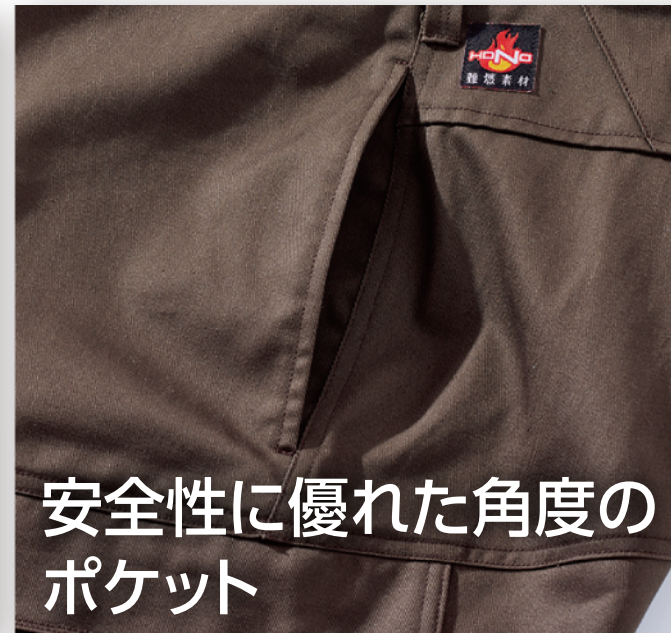
安全性に優れた角度のポケット