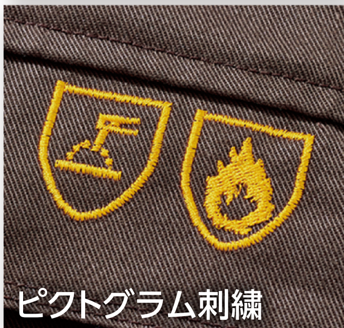
ピクトグラム刺繍