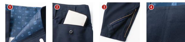
1 こだわりの裏地 2 長財布が入る後ろポケット 3 裾ファスナー 4 前立てダブルストレッチ