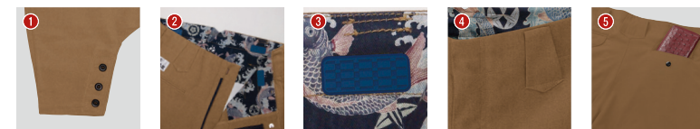
1 裾口三つ釦 2 こだわりの裏地 3 スベリ止め 4 Wストレッチ 5 深い後ポケット