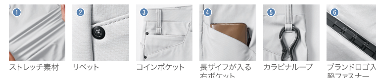
1 ストレッチ素材 2 リベット 3 コインポケット 4 長ザイフが入る右ポケット 5 カラビナループ 6 ブランドロゴ入り脇ファスナー