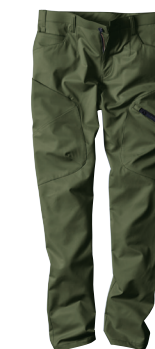
66. アーミーグリーン