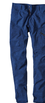
90. ポタニカルネイビー