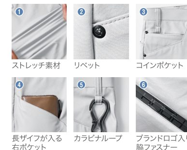
1 ストレッチ素材 2 リベット 3 コインポケット 4 長ザイフが入る右ポケット 5 カラビナループ 6 ブランドロゴ入り脇ファスナー