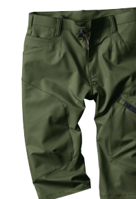
66. アーミーグリーン