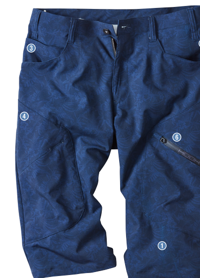
90. ポタニカルネイビー