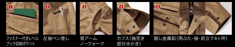
1. ファスナー付きレベル ブック収納ポケット