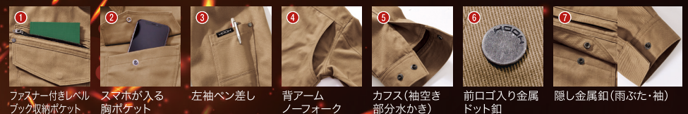
1. ファスナー付きレベル ブック収納ポケット