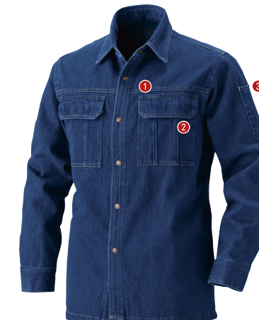
52. インディゴブルー