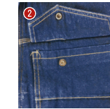
胸ポケット スナップ釦