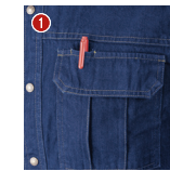
胸ポケットベン差し