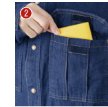
胸ポケット マジックテープ付き