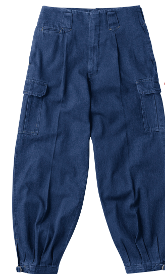
52. インディゴブルー