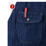
胸ポケットベン差し