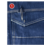
胸ポケットベン差し