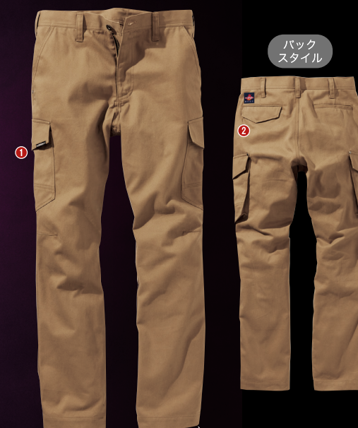
74. キヤメル 裾には紐通し穴付き