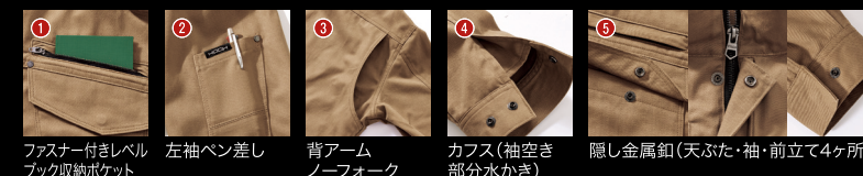
1.ファスナー付きレベルブック収納ポケット 2.左袖ベン差し 3.背アームノーフォーク 4.カフス(袖空き部分水かき) 5.隠し金属釦(天ぶた・袖・前立て4ヶ所)