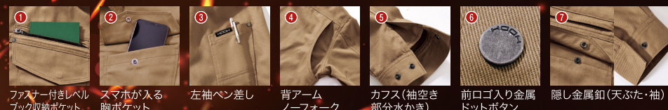
1.ファスナー付きレベルブック収納ポケット 2.スマホが入る胸ポケット 3.左袖ベン差し 4.背アームノーフォーク 5.カフス(袖空き部分水かき) 6.前ロゴ入り金属ドットボタン 7.隠し金属釦(天ぶた・袖)