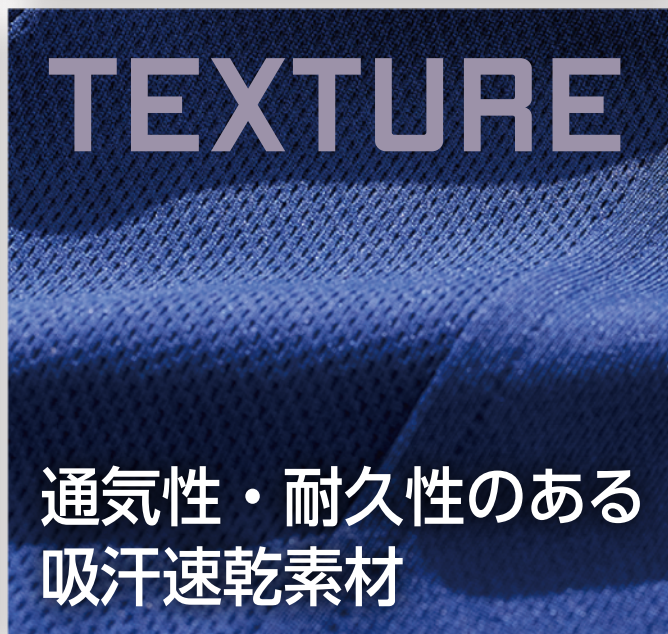
通気性・耐久性のある 吸汗速乾素材