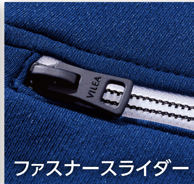
ファスナーズライダー