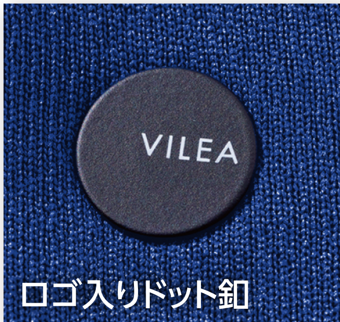
ロゴ入りドット釦