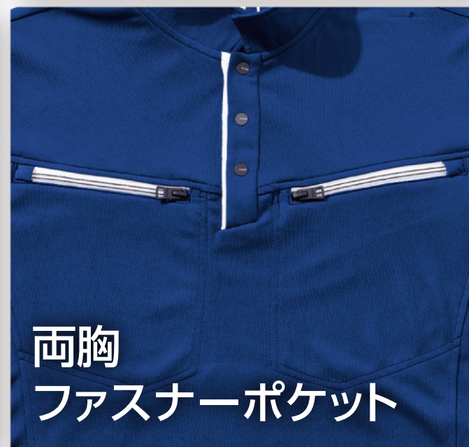
両胸 ファスナーポケット