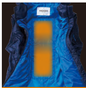
背中にヒーター内蔵