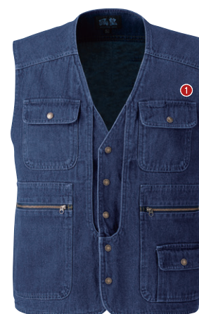
52. インディゴブルー