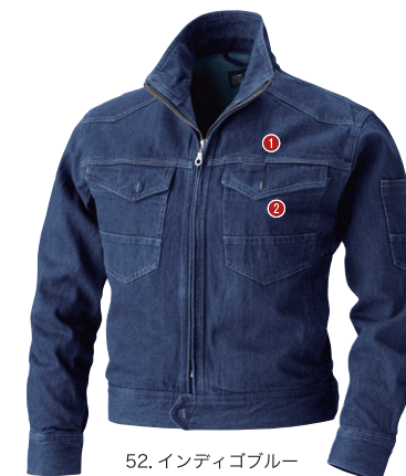
52. インディゴブルー