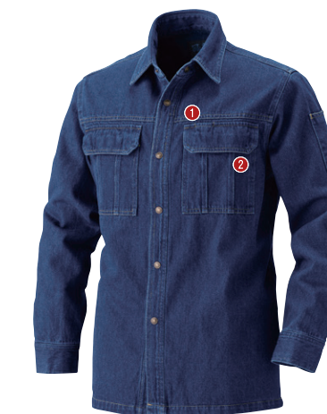
52. インディゴブルー