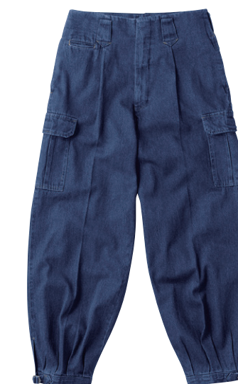
52. インディゴブルー