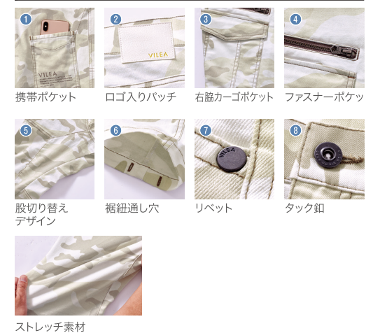
携帯ポケット ログ入りパッチ 右脇カーゴポケット ファスナーポケット