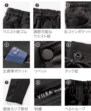
ウエスト総ゴム 調節可能なウエスト紐 右コインポケット