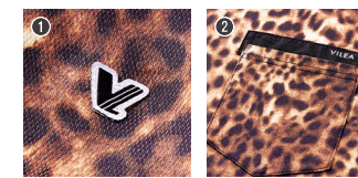
右袖ブランドワッペン 胸ポケット配色