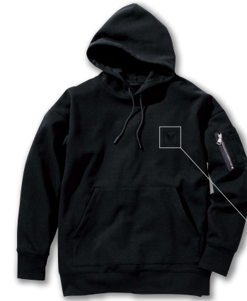
99. クリスタルブラック