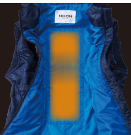
背中にヒーター内蔵