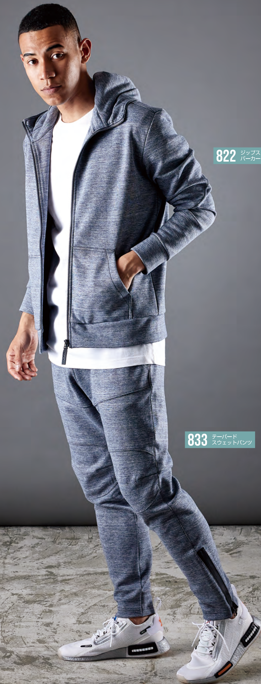
822 ジップスウェットパーカー