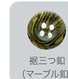
裾口三つ釦 (マーブル釦)