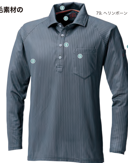
79.ヘリンボーンチャコール