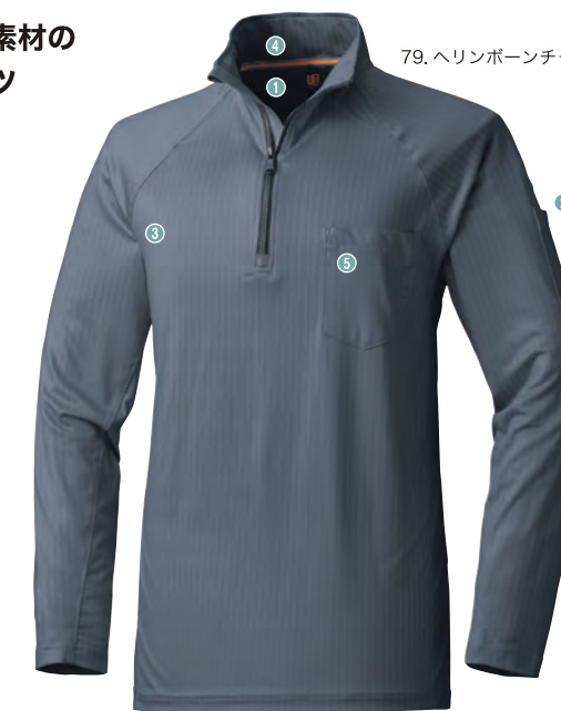
79.ヘリンボーンチャコール